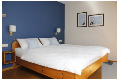
Schlafzimmer mit Doppelbett

(54 m 2 ) in 1. Etage (DG) für 4 Personen